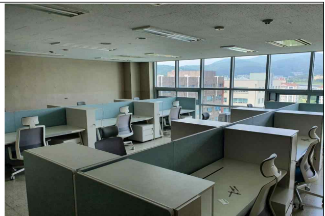
신규연구실 내부 조성